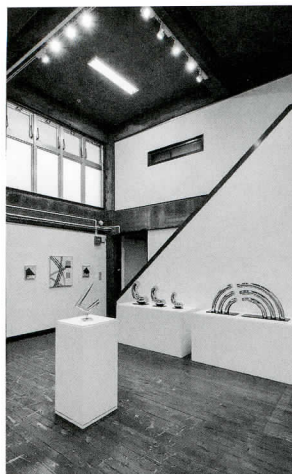
展示風景