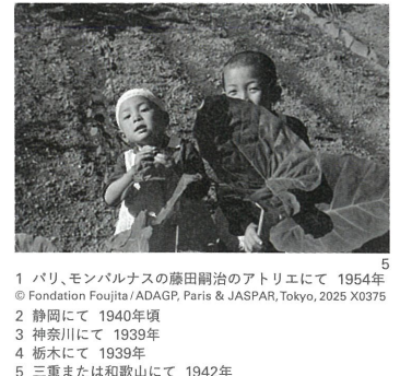
1 パリ、モンパルナスの藤田嗣治のアトリエにて 1954年 © Fondation Foujita / ADAGP, Paris & JASPAR, Tokyo, 2025 X0375 2 静岡にて 1940年頃 3 神奈川にて 1939年 4 栃木にて 1939年 5 三重または和歌山にて 1942年