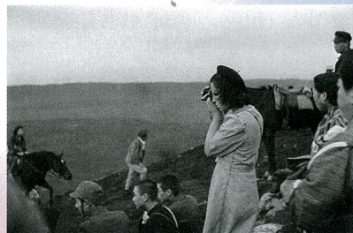
1940(昭和15)年 撮影(大島にて)

なお、参考資料として同時代に刊行された婦人雑誌も展示いたします。写真とあわせて当時の世相を感じていただければ幸いです。