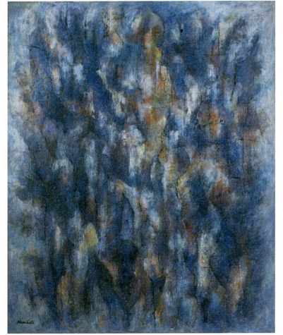
難波田龍起《讃歌》1979年