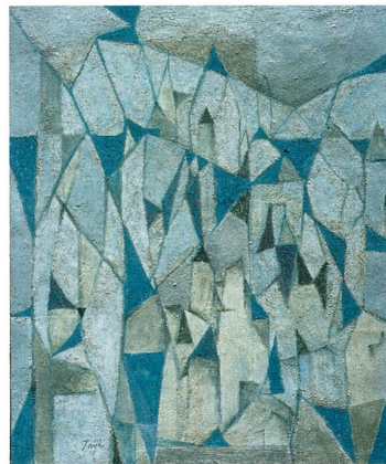
清川泰次《メディタレーニアン風景 55-6》 1955-56年