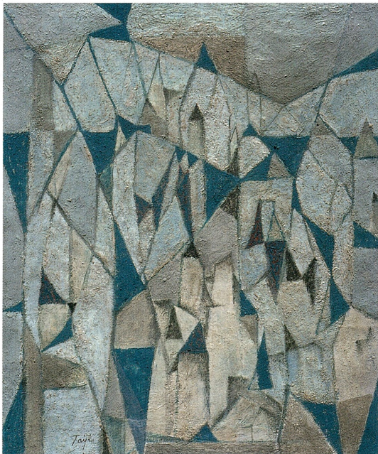
《メディテレーニアン風景55-6》1955—56年