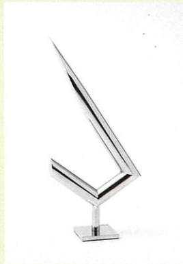
《Stainless Object No.4291》1989年