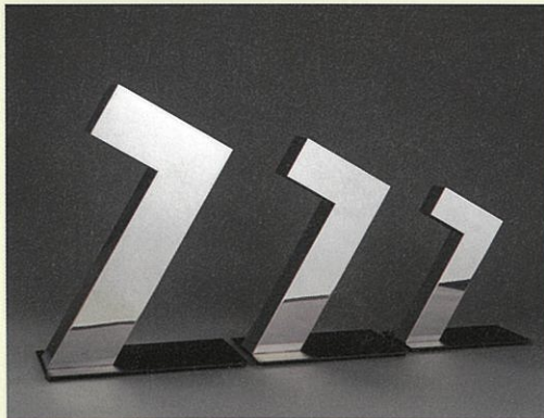
《Stainless Object 7-3 No.4191》1991年

長らく成城の地に暮らした世田谷ゆかりの画家・清川泰次(1919-2000)。初期には具象的な作品を描いていましたが、1950年代に本格的に抽象表現へ移行し、線や色面のみによる表現で、物の形態を写し取ることに捉われない独自の抽象芸術を探索しました。