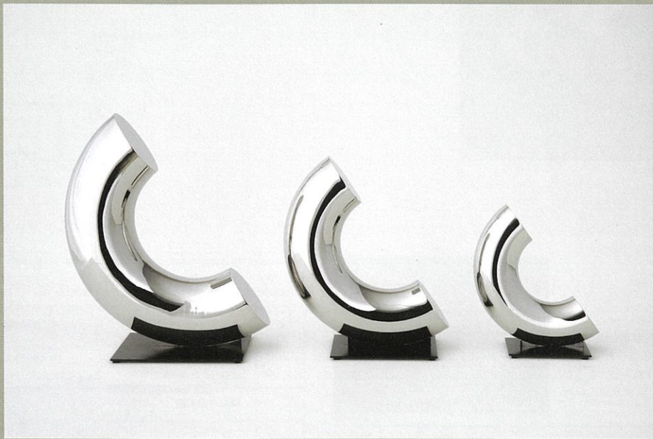
上:《Painting No.2182-3》1982-83年 下:《Stainless Object C-3 No.3891》1991年