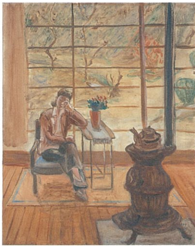
《由紀子・二侯のアトリエにて》1947年